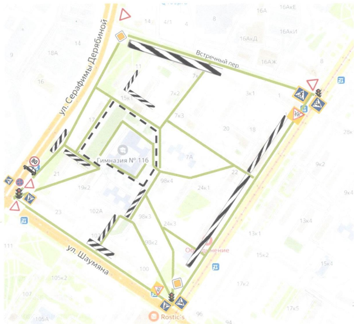
Схема организации дорожного движения в непосредственной близости от образовательного учреждения с размещением соответствующих технических средств организации дорожного движения, маршрутов движения детей и расположения парковочных мест.